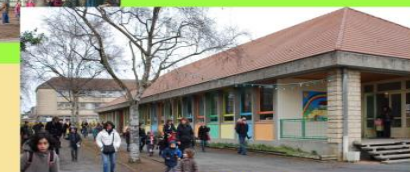
ECOLE JEANNE D'ARC

ECOLLES – COLLEGE – LYCEES GENERAL ET PROFESSIONNEL