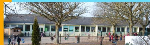
ECOLE NOTRE DAME