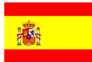
Section Euro. Espagnol