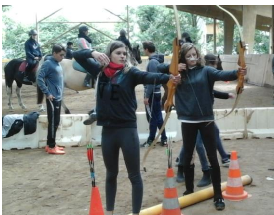
Journée d'intégration de la 3 ème Prépa-Métiers

« Grâce à la 3 ème Prépa-Métiers, j'ai repris confiance en mes capacités. J'ai de meilleurs résultats et je me sens bien dans cette classe. »